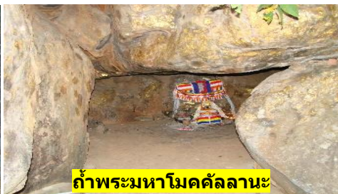
ถ้ำพระมหาโมคคัลลานะ