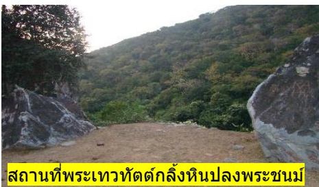
สถานที่พระเทวทัตต์กลิ้งหินปลงพระชนม์