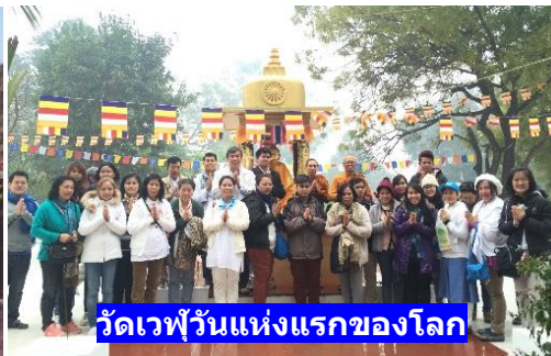
วัดเวฬุวันแห่งแรกของโลก