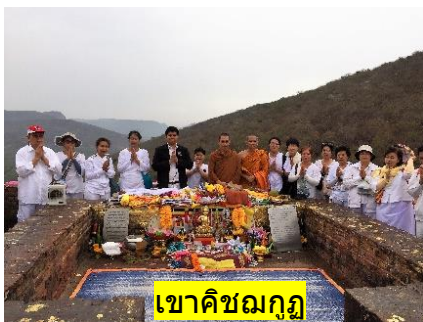
เขาคิชฌกูฏ

09.00 น.- นำคณะเดินธุดงค์ขึ้นสู่ (1) เขาคิชฌกูฏ+นมัสการพระคันธกุฎีที่ประทับของพระพุทธเจ้า+ถวายพระอานนท์พุทธอัฐิจาก +ถ้ำสุกรขาตา ที่พระสารีบุตรบรรลुพระอรหันต์+ถ้ำพระมหาโมคคัลลานะ+หน้าผาเชิงเขาคิชฌกูฏ สถานที่พระเทวทัตต์ กลิ้งหินใส่พระพุทธเจ้าหมายปลงพระชนม์ ทำโลหิตุปปบาท+ (2) ชิวกัมพวัน วัดและโรงพยาบาลหมอชิวกโกมารภังจ์