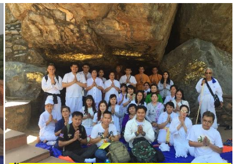
ถ้ำสุกรขาตาที่พระสารีบุตรบรรลุธรรม