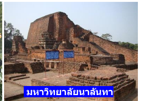
มหาวิทยาลัยนาลันทา