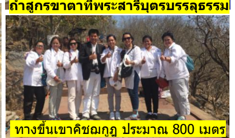
ทางขึ้นเขาคิชฌกูฏ ประมาณ 800 เมตร

หมายเหตุ :- ถนนทางขึ้นเขาคิชฌกูฏ เดินได้สบายๆ ต้องการเสลี่ยงต้องจ้างล่วงหน้า เสียค่าเสลี่ยงเอง (1,500/1,600.-/1,700 รูปี)