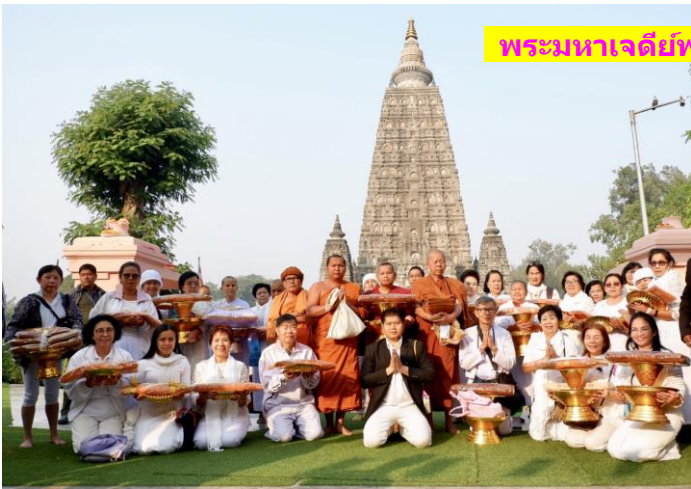
พระมหาเจดีย์พุทธคยา ดันพระศรีมหาโพธิ์ สถานที่ตรัสรู้

โปรแกรมพิเศษ AA : โครงการปฏิบัติธรรม ณ ดันพระศรีมหาโพธิ์ (7 คืน/8 วัน) สังเวชนียสถาน 1 ตำบลที่ตรัสรู้+พุทธสถาน 2 แห่ง : เน้นปฏิบัติธรรม ณ ดันพระศรีมหาโพธิ์ (1) พุทธคยา ดันพระศรีมหาโพธิ์ สถานที่ตรัสรู้ พระมหาเจดีย์พุทธคยา พระพุทธเมตตา (2) ราชคฤห์ เขาคิชฌกูฏ วัดเวฬุวัน แห่งแรกของโลก ตโปธาราม อนุสรณ์อาบน้ำวาระณะ 4 (3) นาลันทา บ้านเกิดพระสารีบุตร-พระมหาโมคคัลลานะ มหาวิทยาลัยนาลันทา หลวงพ่อดำ